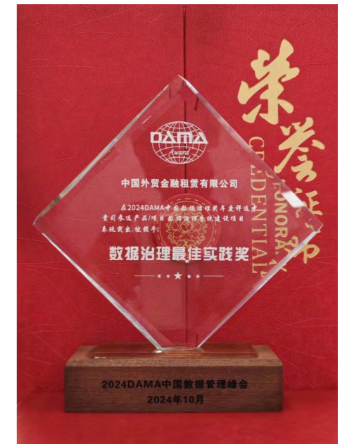
外贸金租荣获 2024DAMA 中国 “数据治理最佳实践奖”