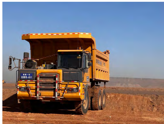
某工程机械企业所租赁的工程机械设备

以与此工程机械企业合作的厂商租赁业务积淀为参考，以厂商租赁业务管理系统上线为依托，公司逐步具备了厂商租赁业务可复制能力，推动金融资本与实体经济深度融合，为租赁业务服务实体经济提供创新方案，开拓高质量服务实体经济新思路。