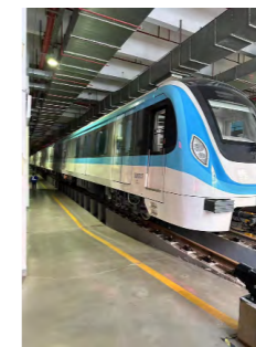
直接租赁服务租赁物地铁车辆投入使用

2024 年 6 月，外贸金租与某轨道交通集团开展合作，向中国中车旗下生产商购买地铁车辆，以直接租赁的形式交付给承租人使用，助力产融深度融合。