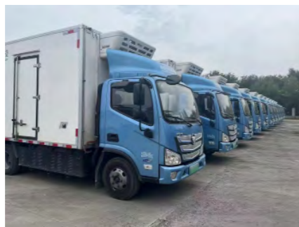
氢燃料电池汽车作为租赁物投入运输使用

2024 年 6 月，公司与河北某换电重卡运营公司开展融资租赁合作，以重卡电池包作为租赁物，向其投放资金 1,000 余万，成功探索新能源商用车电池领域，积累相关业务经验，并促进了承租人在新能源领域的发展。