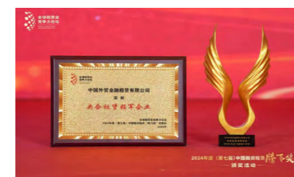
外贸金租荣获 2024 年度（第七届）中国融资租赁 “腾飞奖”央企租赁领军企业