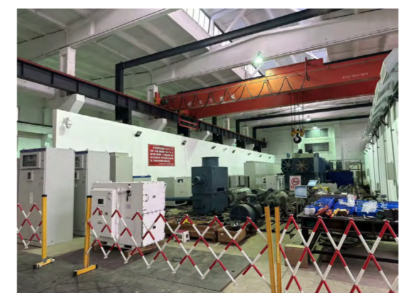
项目租赁物储能设备应用于某矿冶院日常工作