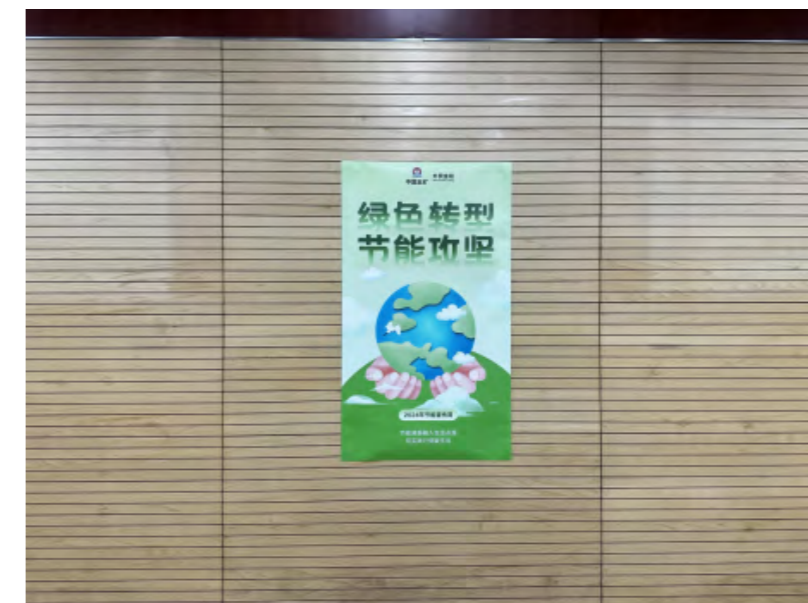
外贸金租办公区域张贴绿色宣传海报