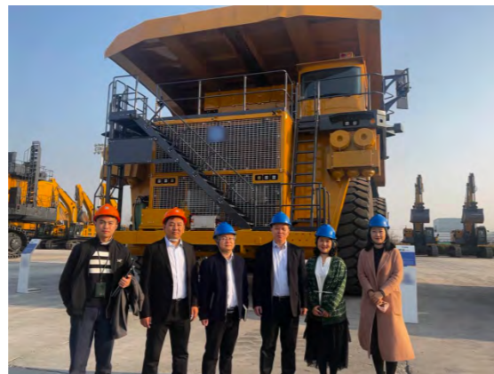
外贸金租领导小组参观某工程机械企业所租赁的工程机械设备