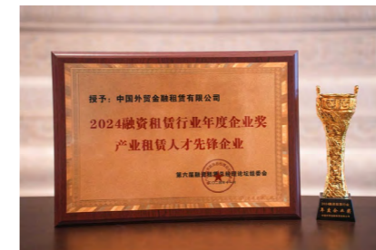
外贸金租荣获 “2024 融资租赁行业年度企业奖--产业租赁人才先锋企业”