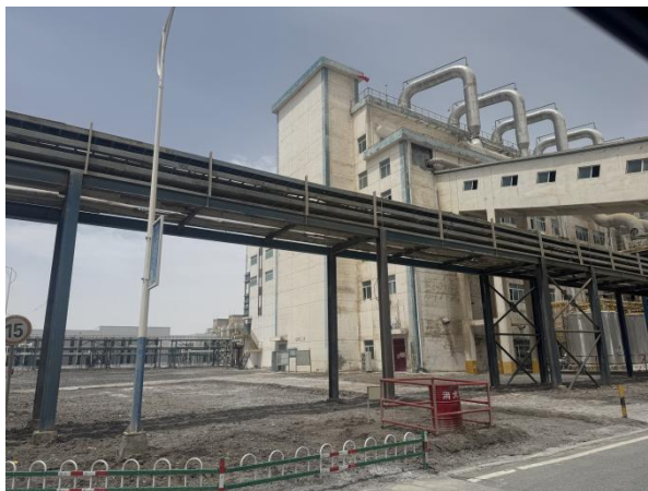
外贸金租盐湖镁业项目现场

外贸金租以绿色租赁助力青海盐湖镁业有限公司（简称“盐湖镁业”），开展蒸汽驱动系统、增压机等动力厂设备的租赁服务，助力建设世界级盐湖产业基地。