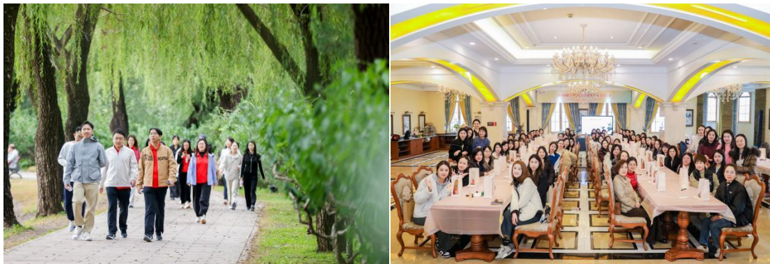
外贸金租健步走及手工艺活动

外贸金租持续推进员工关爱与服务，由工会牵头组织开展关爱员工、帮扶助困等活动；公司持续关注员工身体与心理健康，每年组织员工体检并开展中医健康诊疗活动，提高职工身体健康管理意识，培养职工健康生活方式，为员工健康保驾护航。