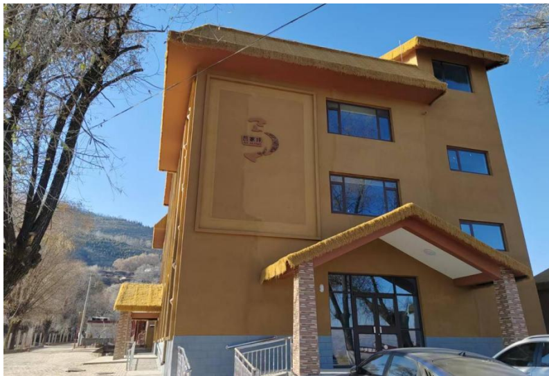
外贸金租临洮县马家窑养老综合服务及活动中心建设项目

2025 年，外贸金租在甘肃临洮县马家窑村开展“和美乡村”建设项目，投入帮扶资金 30 万元，用于购置养老综合服务及活动中心所需的生活设施、康复设备、文化娱乐器材等。项目建成后，有效解决该村及周边 6 个村子的特殊困难老人“做饭难、吃饭难”的问题，并为老年人提供棋牌娱乐、阅读交流、康养保健等服务，进一步丰富老年群体精神文化生活，提升乡村养老服务水平。