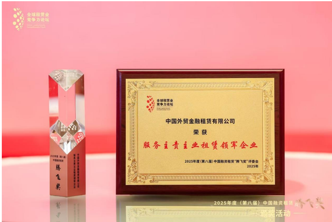
2025 年度（第八届）中国融资租赁“腾飞奖”

公司荣获 2025 年度（第八届）中国融资租赁“腾飞奖”服务主责主业租赁领军企业，《财资》（The Asset）Triple A Awards 最佳 ESG 解决方案奖，DCMM 数据管理能力成熟度 3 级（稳健级）认证。