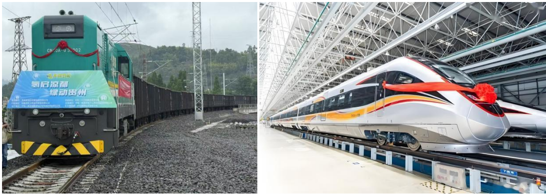
外贸金租绿色交通项目

域，持续加大在新能源交通装备方面的金融支持力度。在新能源物流领域，外贸金租以新能源城配物流车为租赁物，推动“油电替换”，助力“双碳”目标的实现；在轨道交通领域，先后支持新能源氢燃料机车和城际动车组项目落地，其中氢燃料机车项目实现我国该类装备的首次商业化应用，具备零排放、高效率、长续航等优势；在乘用车领域，持续向新能源乘用车项目投放资金，助力新能源领域布局。