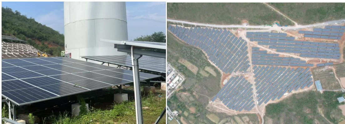
外贸金租光伏项目

深耕光伏发电领域，助力清洁电力发展。 2025 年全年落地光伏项目 11.01 亿元。公司通过持续的业务实践和经验积累，不断提升在光伏领域的专业能力，为未来业务的拓展奠定坚实基础。