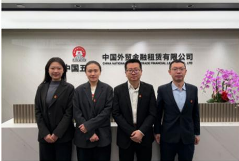
外贸金租“中国恩菲-金川二期项目”党员服务队

三是持续推进清廉文化建设。 常态化开展警示教育，筑牢思想防线。通过召开警示教育大会、廉洁谈话、参观教育基地、经分会警示案例学习等多种形式，以案明纪、以案示警。强化法治引领，增强纪法意识。通过公司党委会、董事会和总经理办公会，全年组织定期学法 24 次，以法治思维引领廉洁理念。融合特色文化，擦亮廉洁品牌。坚持将公司清廉文化建设与弘扬中国特色金融文化深度融合，细化落实具体建设任务 34 项，持续擦亮“清风租赁”廉洁文化品牌；扎实推进清廉项目示范工程建设，打造清廉标杆。紧盯“关键少数”，强化权力监督。建立纪委与党委会商机制；针对各级“一把手”和关键岗位制定监督方案，出台 29 项监督举措，构建“全链条、全周期、全闭环”的监督机制。