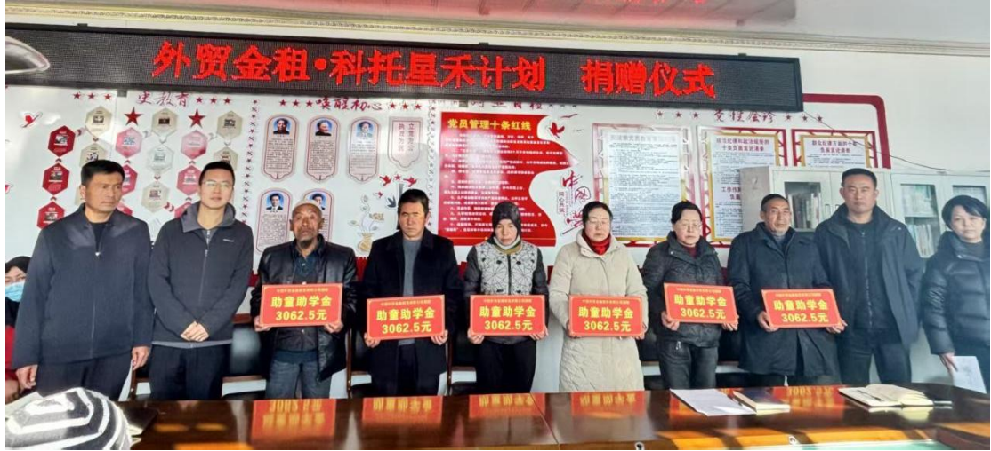
外贸金租和政县科托村助学项目捐赠仪式