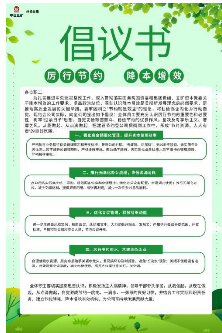
外贸金租办公区节能降碳宣传及倡议书