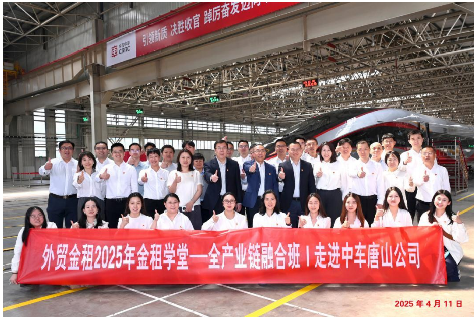
外贸金租 2025 年金租学堂 - 全产业链融合班走进中车唐山